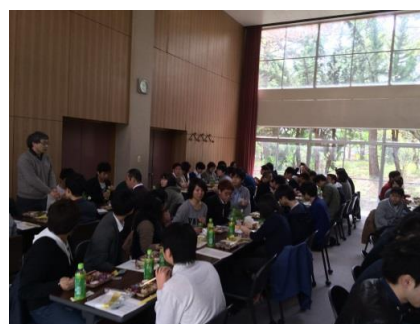
新入生オリエンテーション