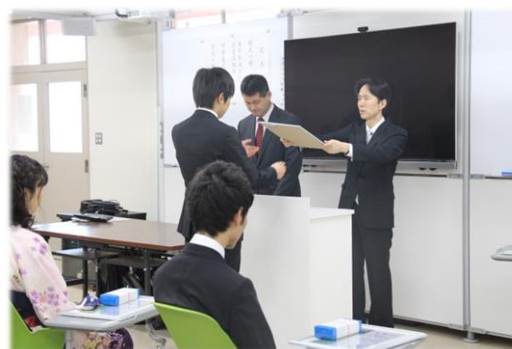
卒業式での学部長表彰