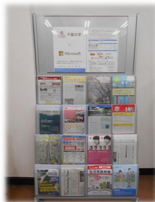
掲示板付パンフレットスタンド (就職情報等、学生向け情報資料の増加のため)