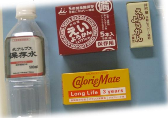
災害時備蓄品(保存食)