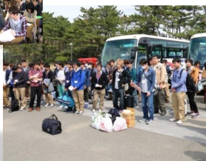
新入生オリエンテーション