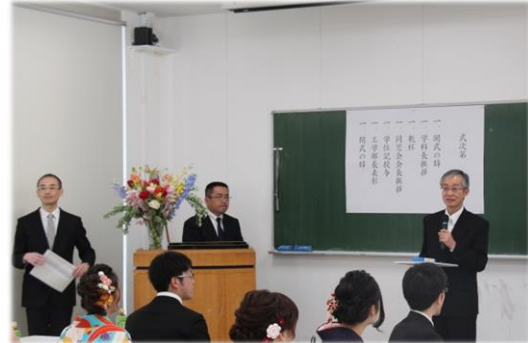
卒業式での学部長表彰